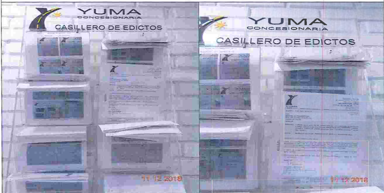
EDICTOS DE LA R_19915 YC-CRT-75656